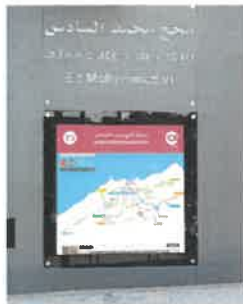
Sur le plan du réseau global imprimé sur plexi glace et situé sur les locaux techniques de toutes les 149 stations en service soit 298 cartes plan au total