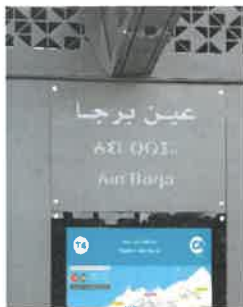
Sur les 2 locaux techniques de la station concernée