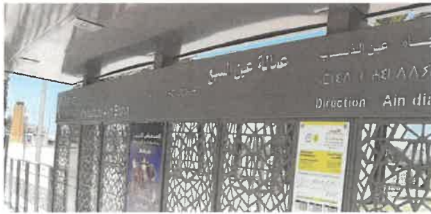
Sur les abris de la station concernée côté quai et côté rue