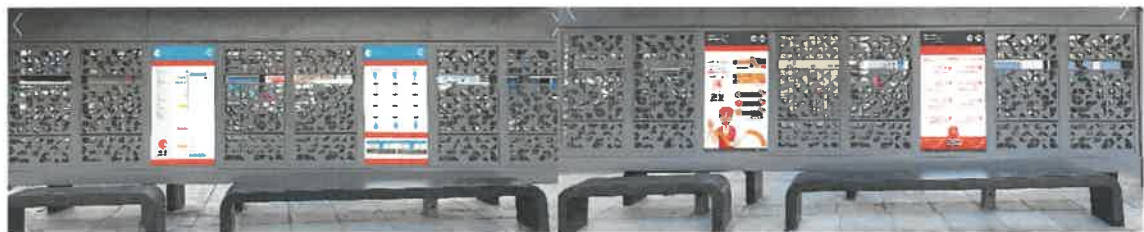
Sur les panneaux d'information affichés sur les abris